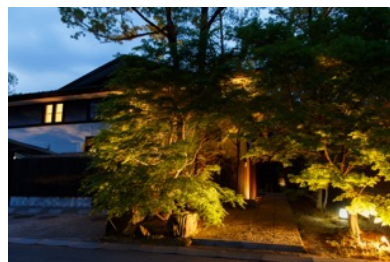
那須高原の自然が、お客様をお出迎え致します