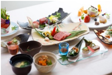
ある日の和食会席 (季節や仕入れにより変わります)

縁側に座って、ライトアップした庭園を見ながらのんびりと過ごすのもおすすめです。料理長こだわりの季節の彩りを、どうぞ心ゆくまでご堪能ください。